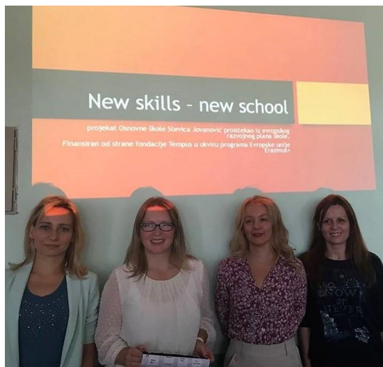
Članovi tima za mobilnost