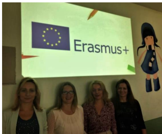
Članovi tima za mobilnost

Tim za mobilnost koji je u okviru Erasmus+ projekta u avgustu mesecu boravio na obuci u Berlinu, 27. septembra je održao prezentaciju seminara za učitelje, nastavnike i stručne saradnike u prostorijama škole.